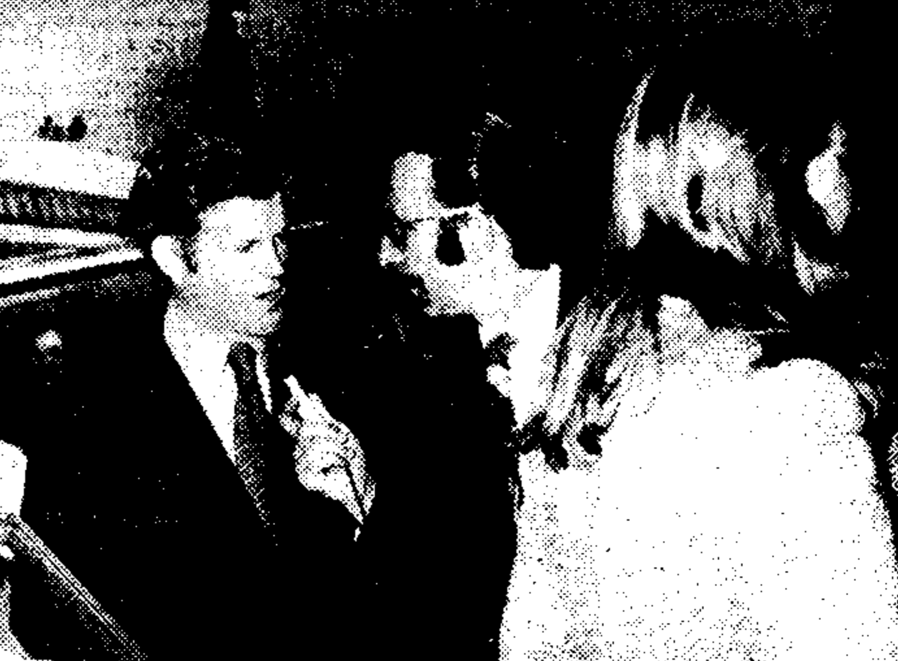
Ὁ Ἐντουαρτ Κένεντυ ἐπὶ ἀποβίτου ἀ ἐπιβίτου τοῦ ἀεροπλάνου...