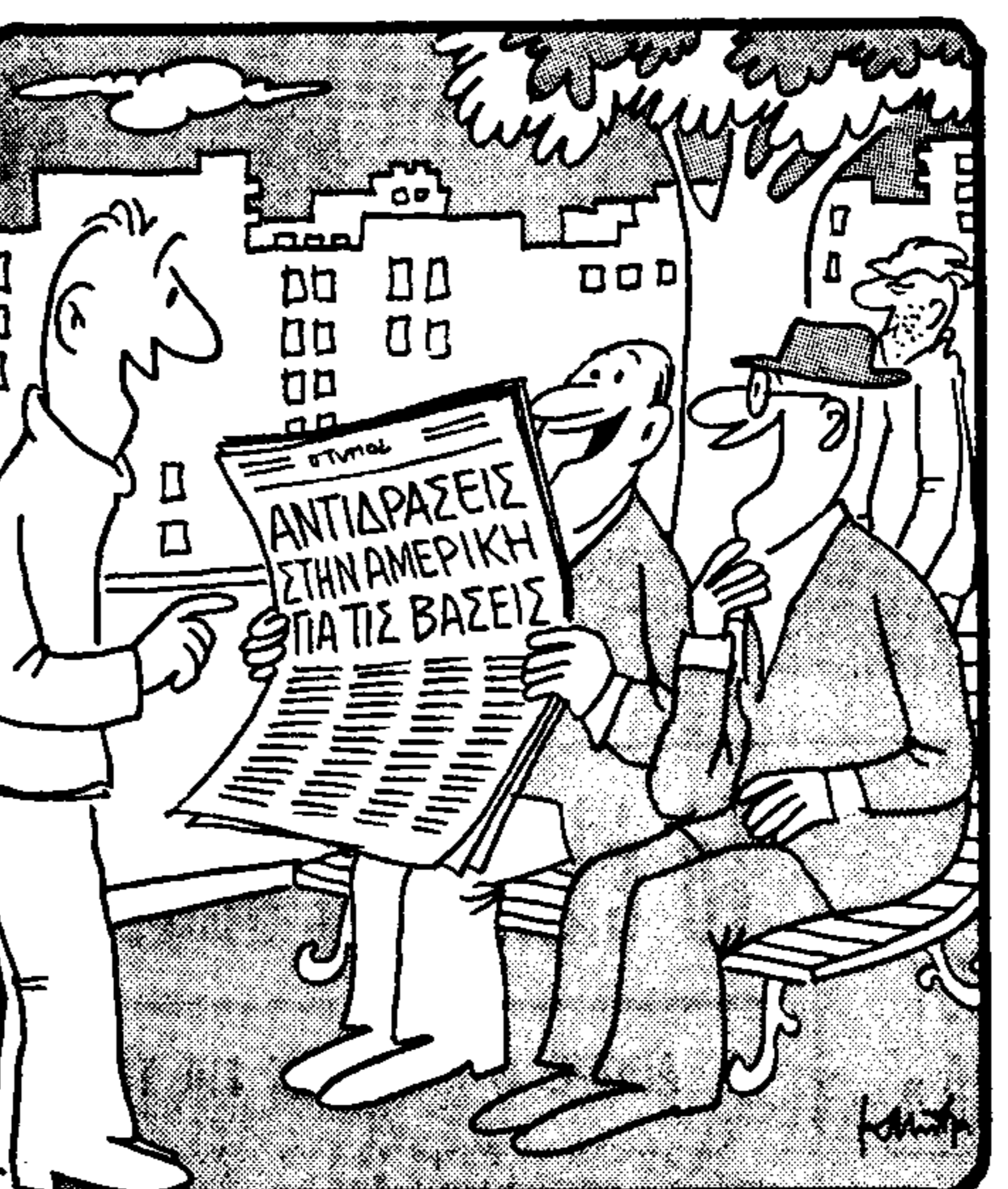
— Τίς βρίσκουν, φαίνεται, ἀκριβέες...